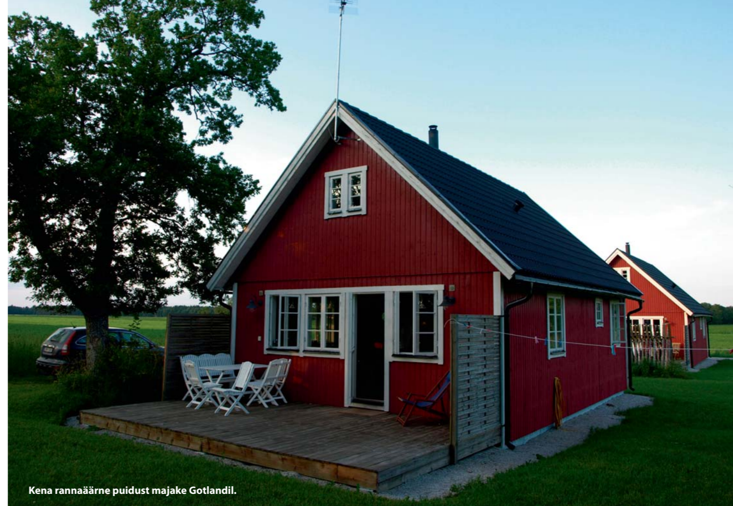
Kena rannaäärne puidust majake Gotlandil.

Kuna täispuidust seinad on head niiskuse tasakaalustajad, siis on sellistes hoonetes reeglina inimesele sobiva suhtelise niiskusega siseõhk. Puit on hea soojapidavusega ja korralikult ehitatud palkmaja ei vajagi eraldi soojustamist. Kontrollima peaks ainult palgivaheid (varasid), nurki ja ka suuremate lõhede piirkondi. Need on kohad, kus on soojakadu suurem ja mida peab korralikult tihendama.