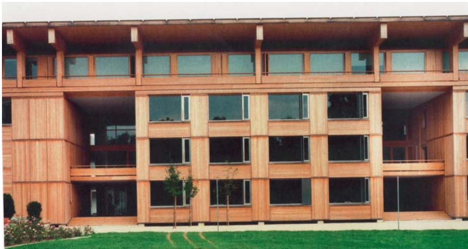
Kes ütles, et kõrghoonet ei saa puidust ehitada . Ka kolmekordset koolimaja saab rajada puidust. Pildil olev hoone asub Biel'is, Šveitsis.

vundamendi vahele on kindlasti vaja paigaldada hüdroisolatsioon.